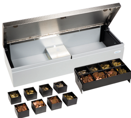
Coin Cups serienmäßig